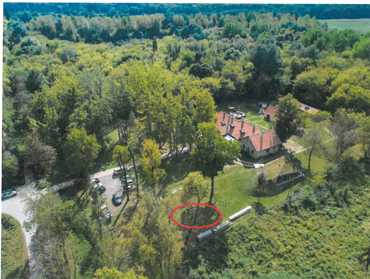
Grupa 2, Lokacija 1

Grupa 3 – Jedno umjetničko djelo/skulptura s tematikom Kultura i tradicija. Djelom/skulpturom potrebno je vizualno predstaviti motive vezane za Baranju poput narodnih nošnji i običaja, specifičnosti gastronomije i vina te specifičnih obilježja arhitekture, povijesti, multikulturalnosti i multietničnosti Baranje. Djelo/skulptura će biti smještena u gradu Osijeku te će služiti kao početna točka za posjetitelje/turiste koji namjeravaju posjetiti Baranju i samim time predstaviti segmente baranjskih kulturno-tradicijskih obilježja.