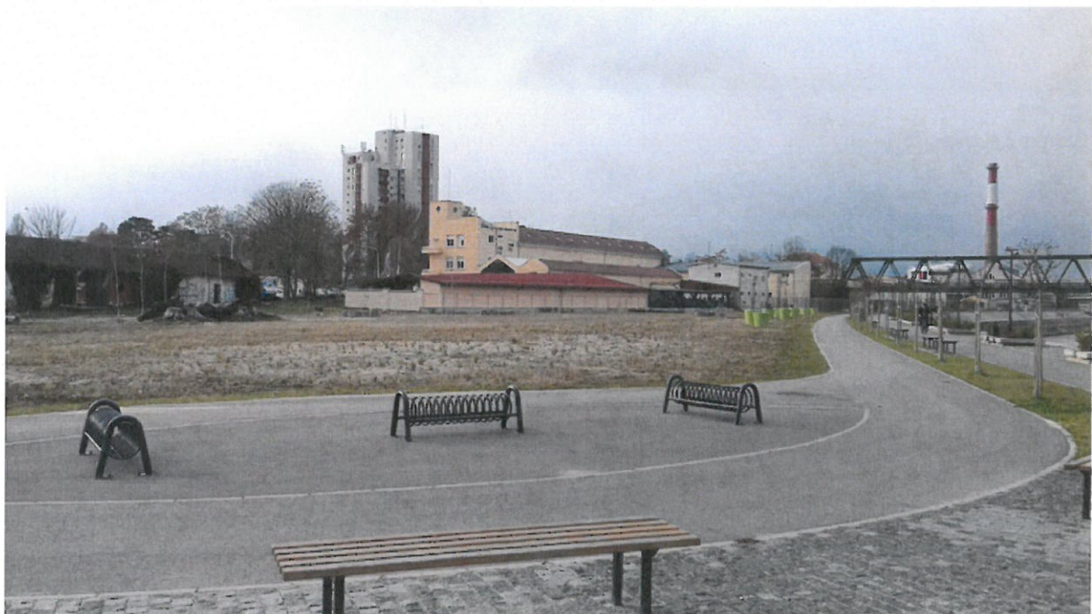
Grupa 3, Lokacija 1