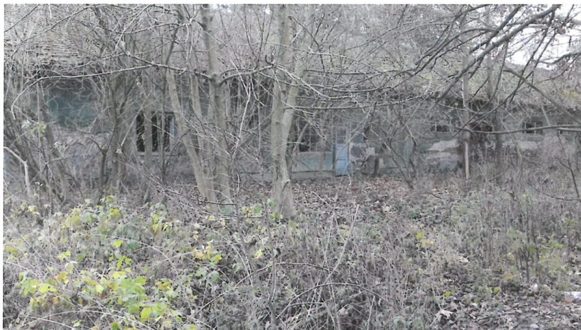
Grupa 1, Lokacija 1

Grupa 1 – Četiri umjetničke instalacije s tematikom biljnog i životinjskog svijeta Baranje i Kopačkog rita. Umjetničke instalacije trebaju prikazivati neke od najvažnijih biljnih i životinjskih vrsta na području Baranje i Kopačkog rita poput jelena, divlje svinje, orla štekavca, kukaca, vrbe, topole, hrasta i sl. Umjetničke instalacije s tematikom biljnog i životinjskog svijeta biti će postavljene na četiri lokacije na području Zlatne Grede, duž poučne pješačke staze „Blago močvare“.