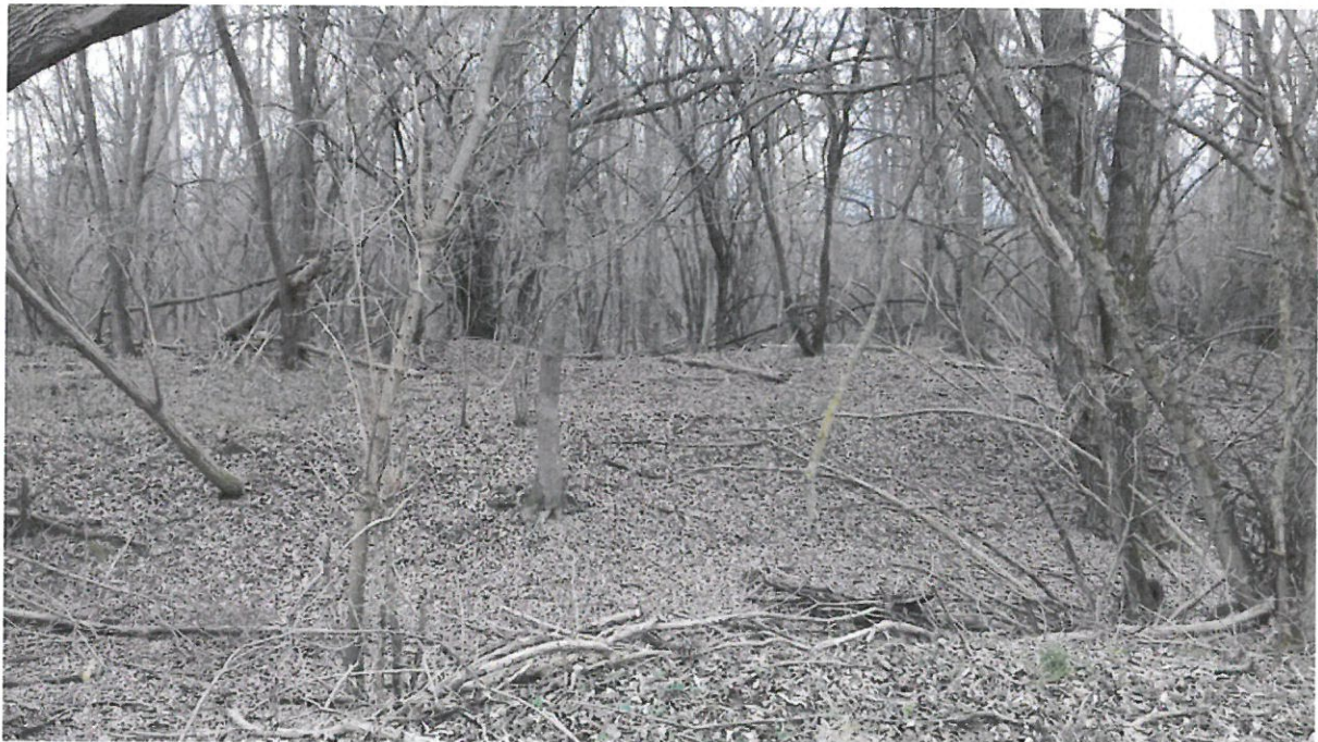
Grupa 1, Lokacija 2