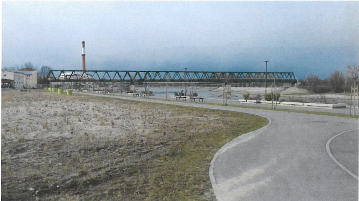
Grupa 3, Lokacija 1