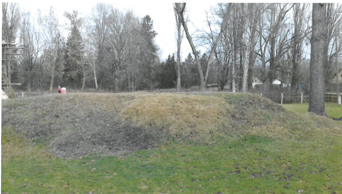
Grupa 2, Lokacija 1