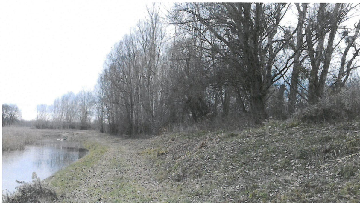
Grupa 1, Lokacija 4