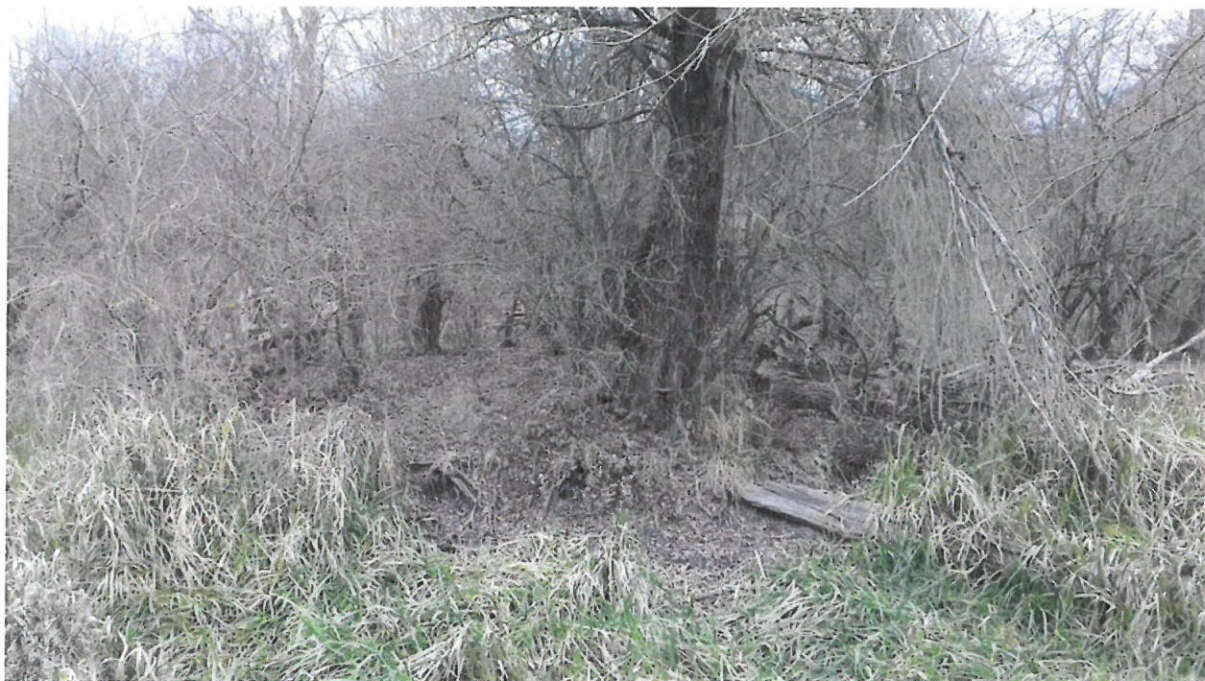
Grupa 1, Lokacija 3