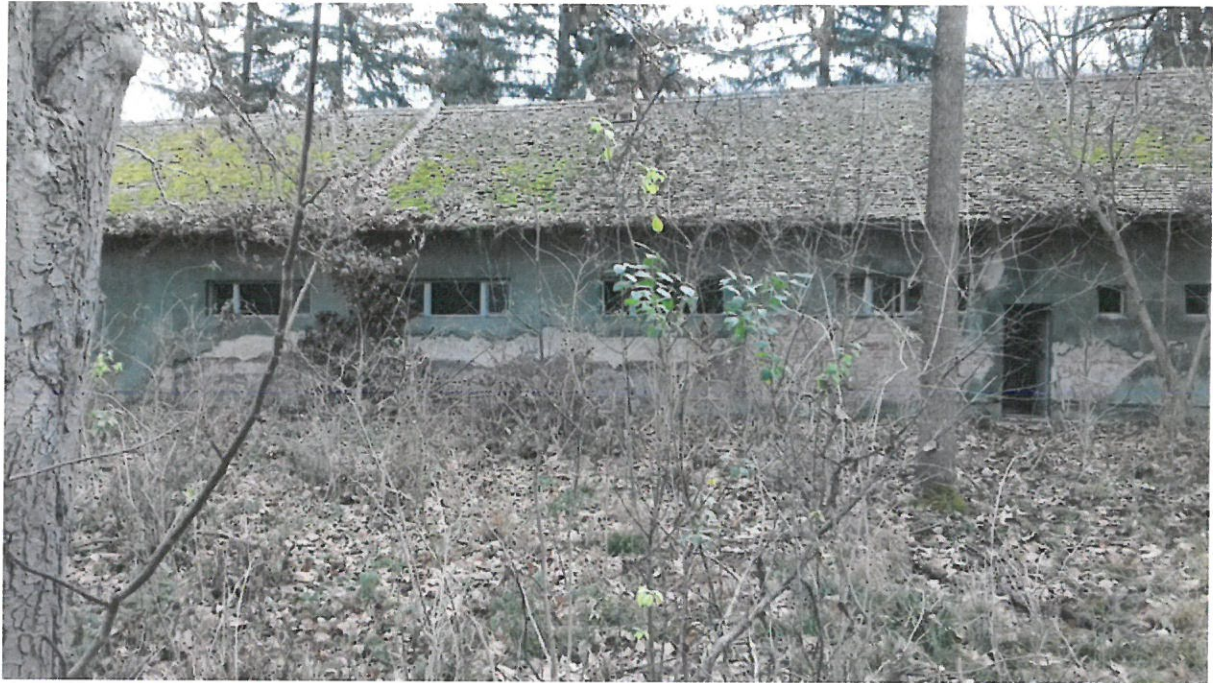
Grupa 1, Lokacija 1