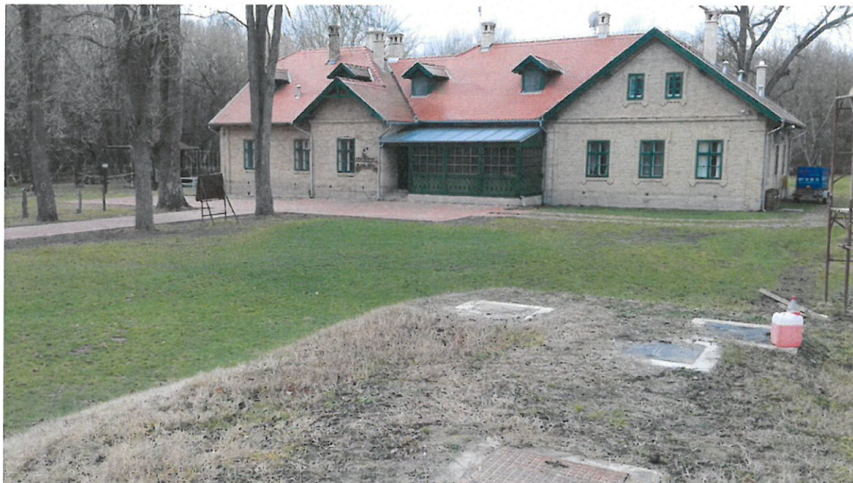
Grupa 2, Lokacija 1

Umjetnička instalacija s tematikom okoliša i održivog razvoja bit će postavljena u sklopu dvorišta Eko centra Zlatna Greda.