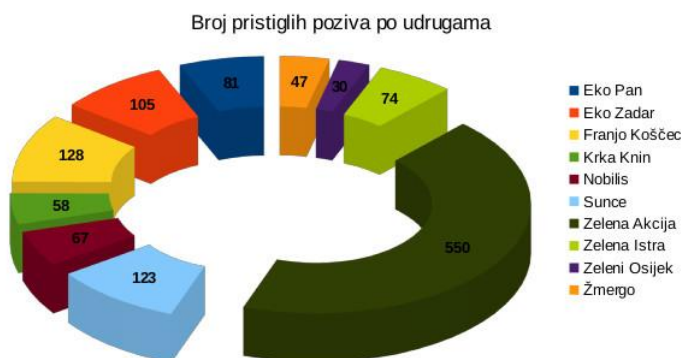
Grafikon 1. Zaprimljene prijave po udrugama članicama u 2016.

I dalje je najveći broj prijava u kategoriji otpad . Unutar te kategorije u 2014. zaprimljeno je 457 prijava što čini više od 36% od ukupnog broja prijava.